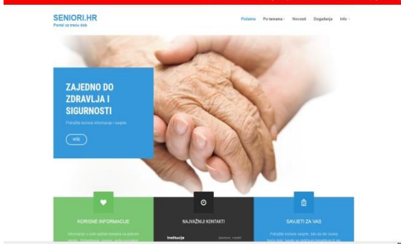
Portal za treću dob: www.seniori.hr