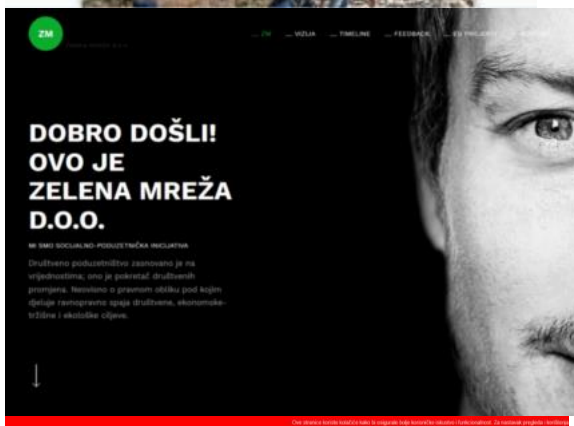
Zelena mreža d.o.o. www.zelenamreza.hr